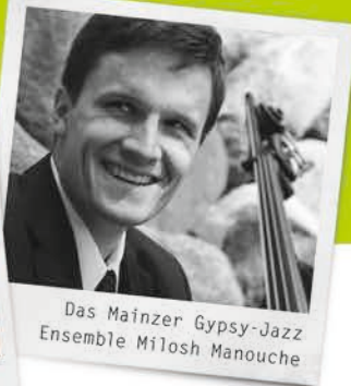
Das Mainzer Gypsy-Jazz Ensemble Milosh Manouche