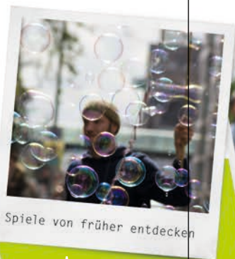
Spiele von früher entdecken