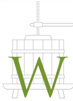
HOCHHEIMER WEINBAUMUSEUM GESCHICHTE DES WEINBAUS

Das Hochheimer Weinbaumuseum zeigt die Arbeit des Winzers von der Anlage eines Weinbergs bis zur Flaschenabfüllung.