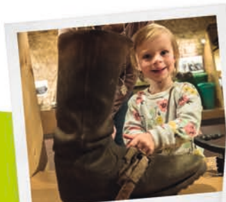
Weinanbau entdecken im Weinbaumuseum