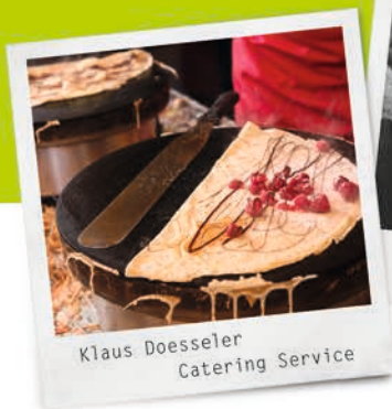
Klaus Doessler Catering Service