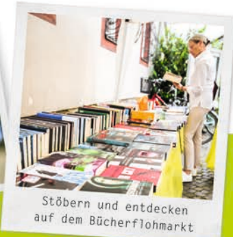
Stöbern und entdecken auf dem Bücherflohmarkt

Entdecken Sie die Hochheimer Stadtgeschichte, schmökern Sie auf dem Bücherflohmarkt, erkunden Sie den historischen Weinanbau und erfahren Sie Spannendes über die Kunst des 20. Jahrhunderts.