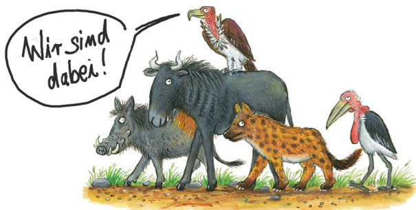
Abb. aus: Die hässlichen Fünf © Julia Donaldson und Axel Scheffler 2017

Sonntag, 14. Oktober von 14 bis 18 Uhr Augen auf! Wir gehen auf Safari!