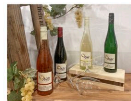
Abb.: © Weingut Kahl

Wickerer Straße 54 – Ausserhalb 65239 Hochheim am Main Tel.: 06145 5480980 Fax: 06145 5480981 info@weingut-kahl.de www.weingut-kahl.de