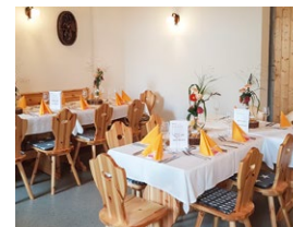
Abb.: © Weingut Falkenbergerhof

Wieserruh 3 65239 Hochheim am Main Tel.: 06146 90 999 34 Fax: 06146 90 999 35 info@weingut-falk.de www.weingut-falk.de