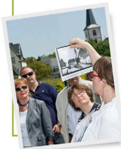
Abb.: Stadtführung

Taxi Taxi Martin Althen Tel.: 06146 4343 Taxi Hochheim Tel.: 06146 9098979