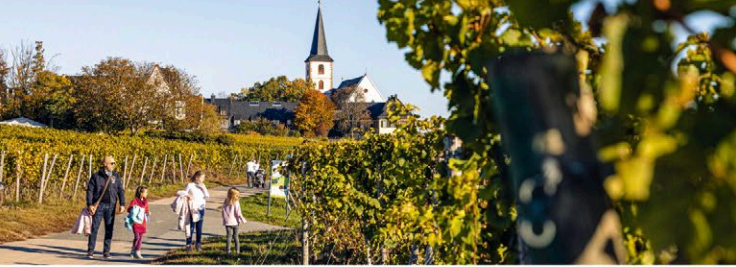
Abb.: © Woody T. Herner