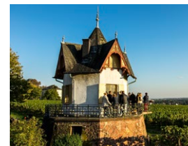
Abb.: © Falk Zimmer

Mainzer Straße 28 65239 Hochheim am Main weckesser-hochheim@gmx.de www.daubhaeuschen.de