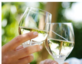
Abb.: Weingläser

Dresdener Ring 13 65239 Hochheim am Main Tel.: 06146 3805 gutsschaenke.pfaff@gmail.com www.gutsschaenke-pfaff.de