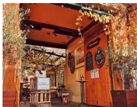
Abb.: © Weingut Preis

Rathausstraße 17 65239 Hochheim am Main Gutsausschank Tel.: 06146 9674 Weingut Tel.: 06146 7620 weingut@weingut-preis.de www.weingut-preis.de