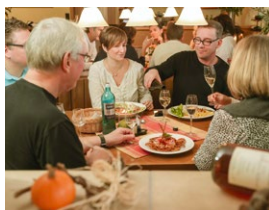
Abb.: © Woody T. Herner

Am Weiher 49 65239 Hochheim am Main Tel.: 06146 3722 Fax: 06146 3952 info@weingut-dienst.de www.weingut-dienst.de