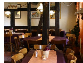
Abb.: © Gutsausschank „Zum Woiggel“

Neudorfstraße 8 65239 Hochheim am Main Tel.: 06146 7696 info@woiggel.de www.woiggel.de