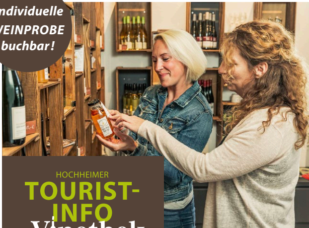
Abb.: alle TL-Bilder auf dieser Seite © Woody T. Heimer