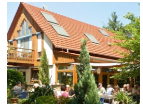
Abb.: © Gutsausschank Lindenhof

Massenheimer Landstraße 65239 Hochheim am Main Tel.: 06146 9155 info@gutsausschank-lindenhof.de www.gutsausschank-lindenhof.de