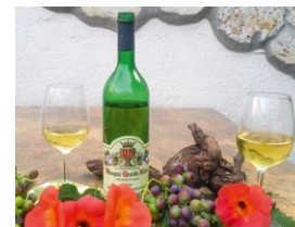
Abb.: © Weingut Quink-Klein

Margarethenstraße 5 65239 Hochheim am Main Tel.: 06146 9817 Fax: 06146 835978 info@quink-klein.de www.quink-klein.de